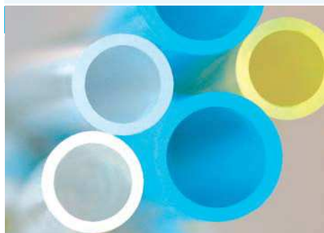
Tubi tecnici calibrati in poliammide 12 - norma DIN 74324